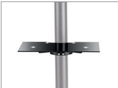
Optional: Braclabs-Stand Frontshelf (Art.-Nr.: 1984)