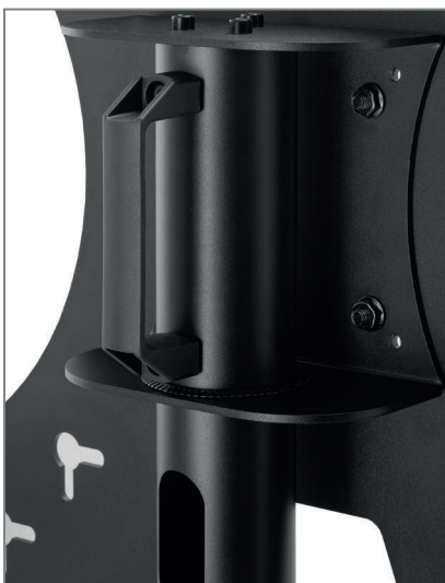
inkl. Griff auf der Säulerrückseite