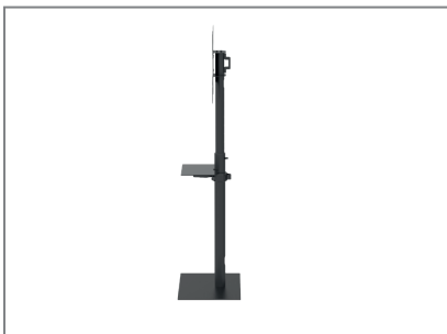
asymmetrische Bodenplatte erlaubt eine Positionierung nah an der Wand