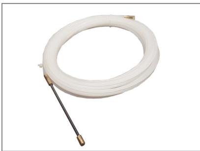
inkl. praktischer Kabeldurchzugshilfe